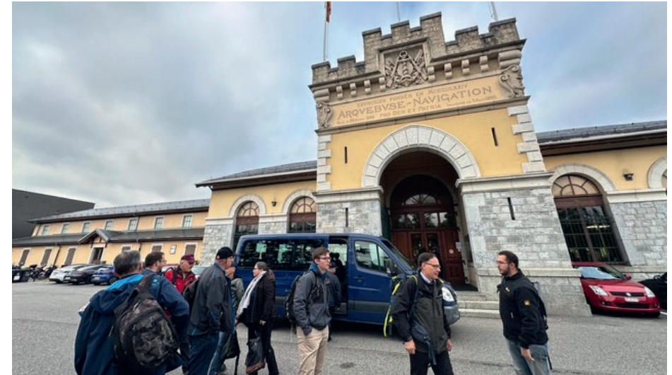
Der wunderschöne Schiessstand der Arquebuse in Genf.