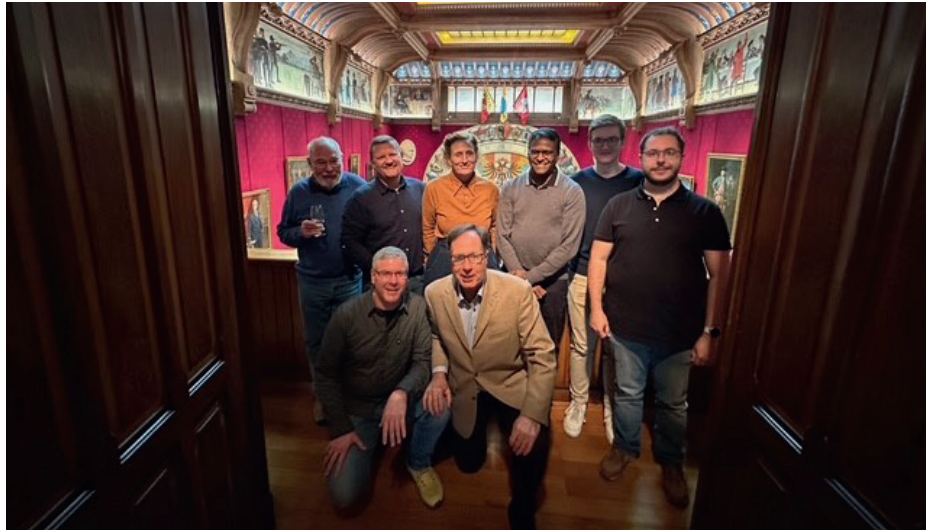
Der mit Samt tapezierte und mit Ölgemälden der ehemaligen Präsidentenportraits dekorierte Saal der Könige. Beide Pistolengruppen der Stadtschützen Olten.